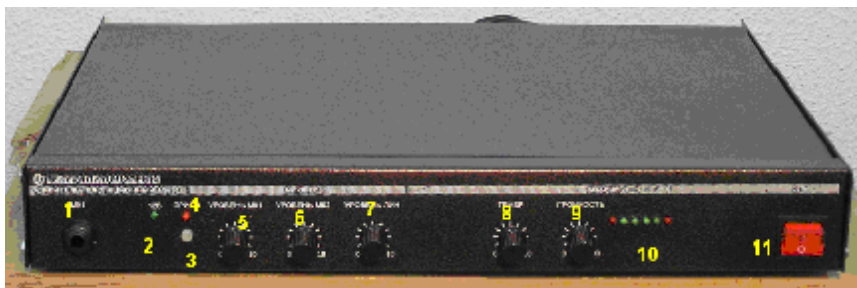
Рис. 1. Вид передней панели УМ спереди.

1.3.2. Органы регулировок и индикации трансляционного усилителя АС-50 изображены на рисунке 1 и 2